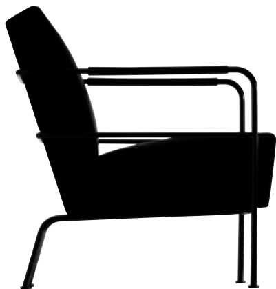
CINEMA – 1993 CINEMA – brons, 2012