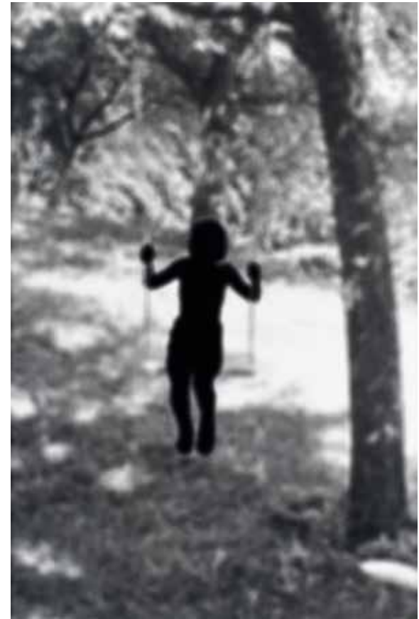
Utan titel/Ohne Titel (Gunga bak/Zurückschaukeln). Silvergelatinfotografi. 1992-2000.