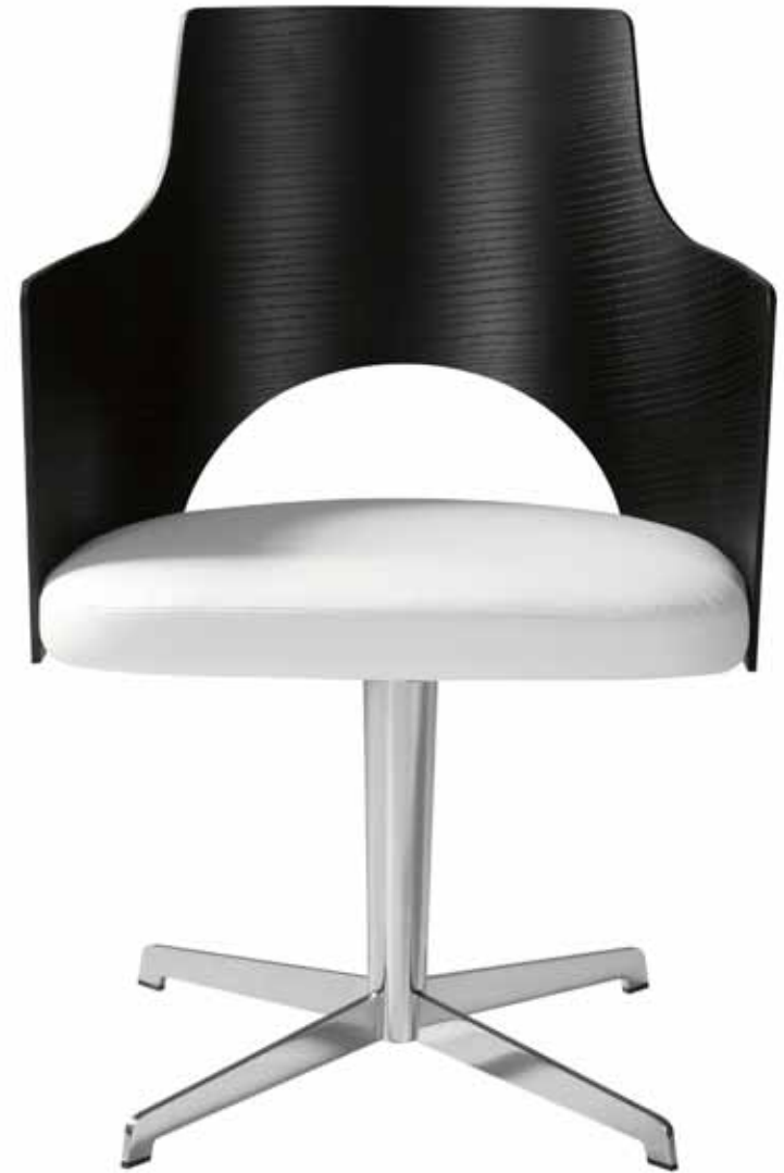
CORTINA – 2005