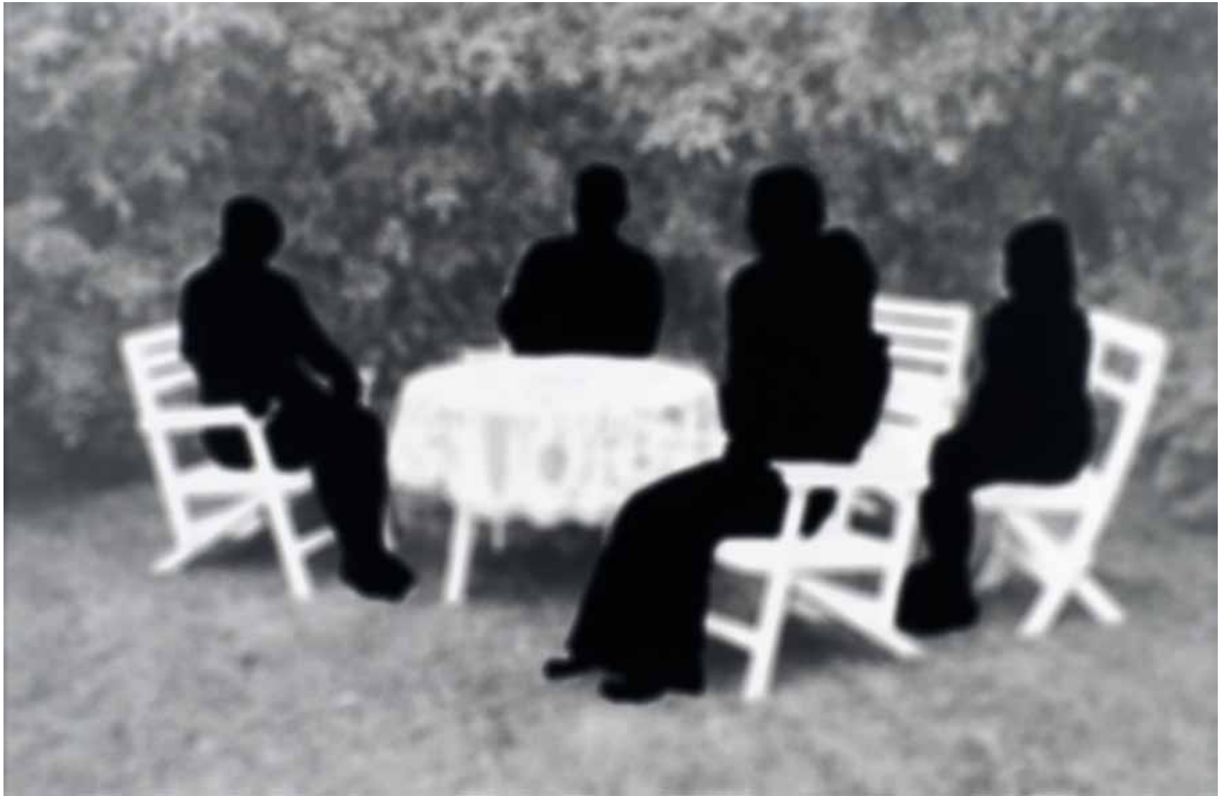
Utan titel/Ohne Titel (Söndag/Sonntag). Silvergelatinfotografi. 1992-2000.