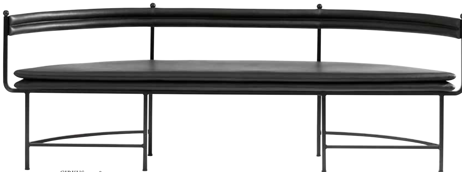
CIRKUS – 1989