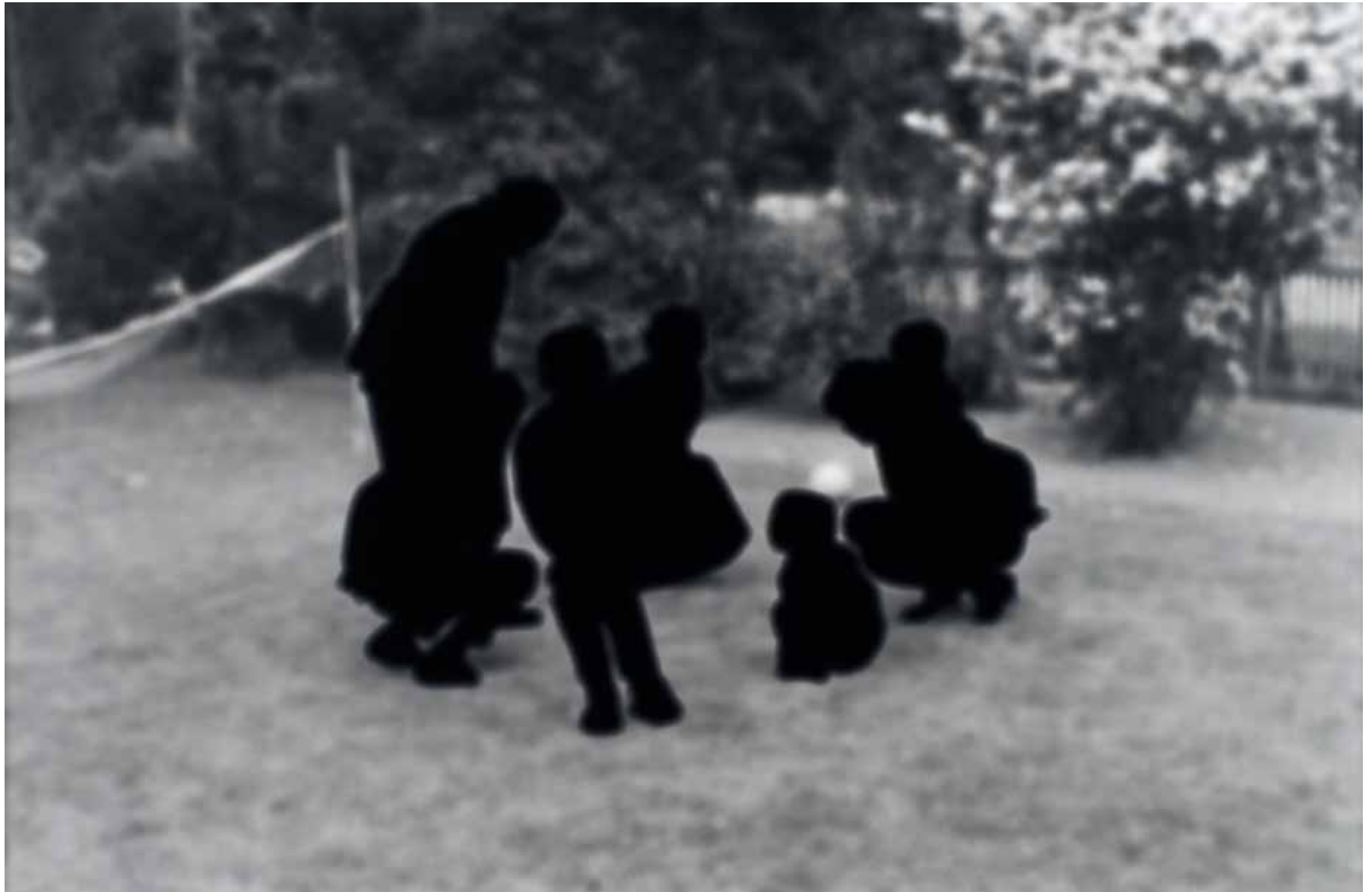
Utan titel/Ohne Titel (I ring/Im Kreise). Silvergelatin fotografi. 1992-2000.