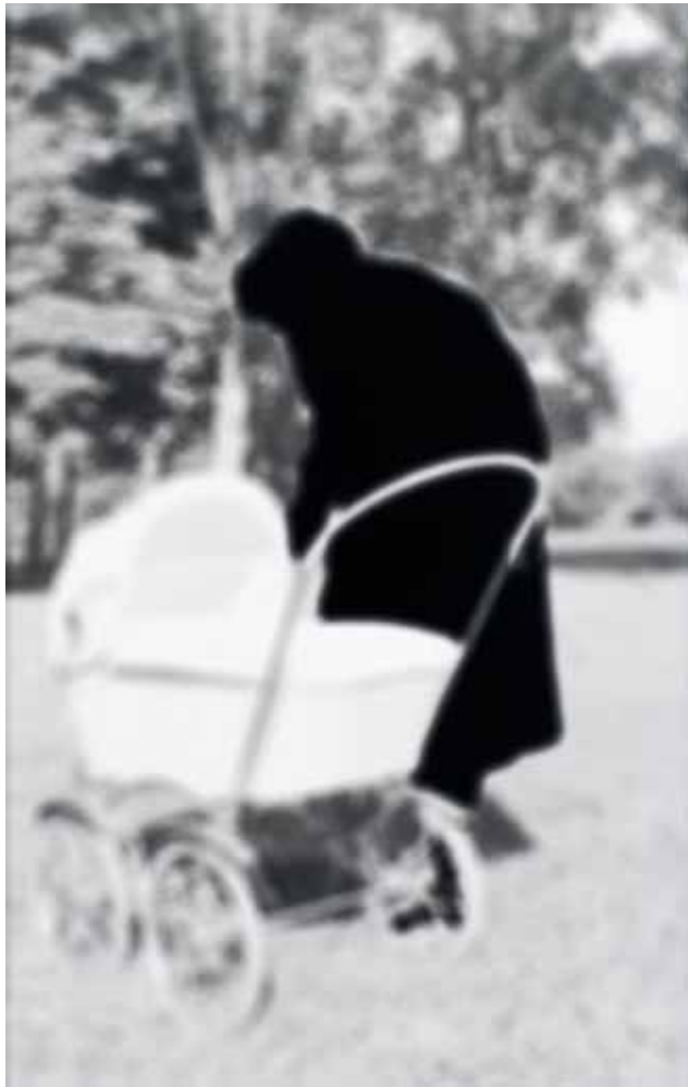
Utan titel/Ohne Titel (För alltid/Für Immer). Silvergelatinfotografi. 1992-2000.