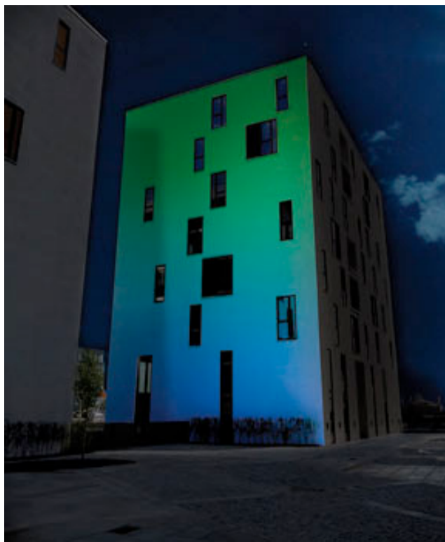
i-LèD STARLINE belyser fasaden, läs mer nedan.